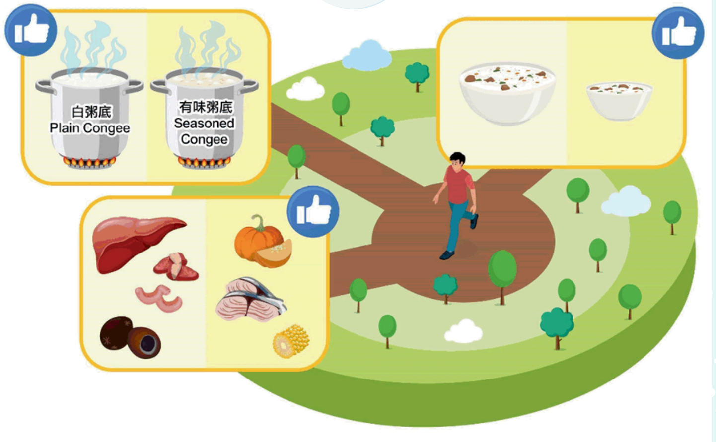
圖：作出健康選擇以減少進食粥品所攝取的鈉：選用鈉含量較低的配料如魚肉和蔬菜、選用只加入少許或不加調味料的白粥作為粥底及進食分量較少的粥品