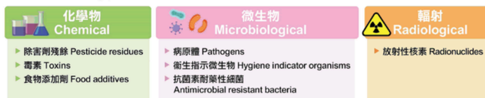
圖：食物安全中心食物監測計劃監察來自不同層面的食物，涵蓋各類食物安全範疇